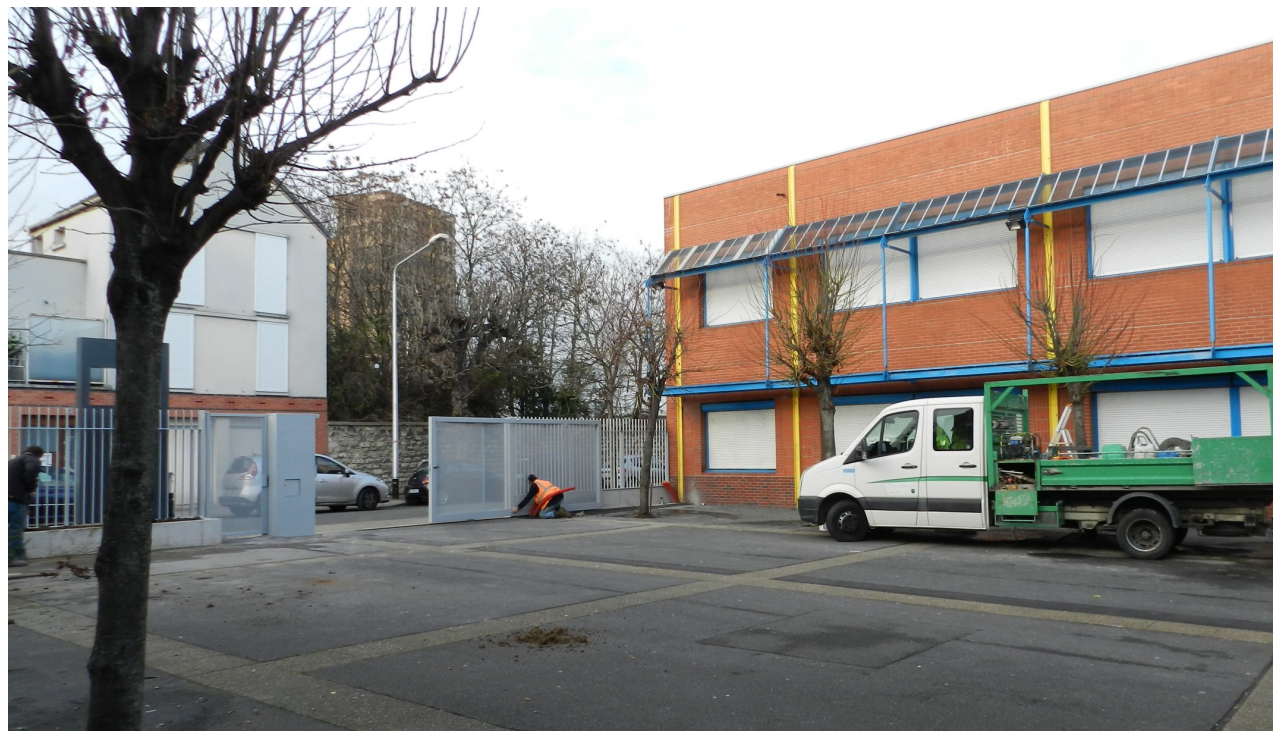
Lycée Denis Papin-Réaménagement du Parvis

*fabrication sur mesure dans notre atelier